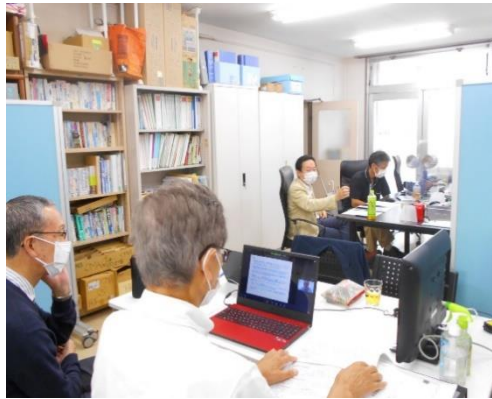
(研修部会スタッフ)