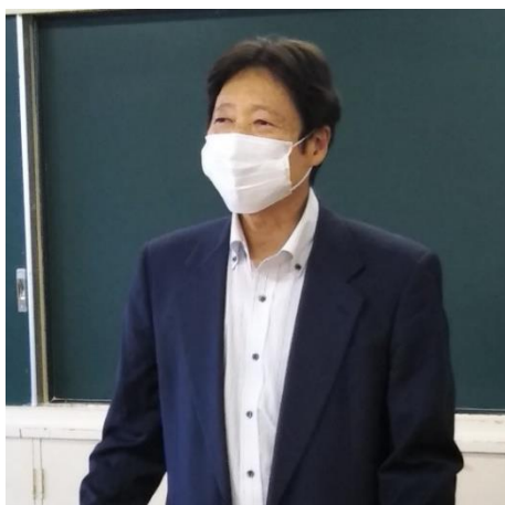
(総会風景・前会長)